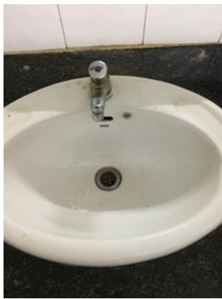
อ่างล้างมือ