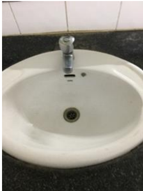
อ่างล้างมือ