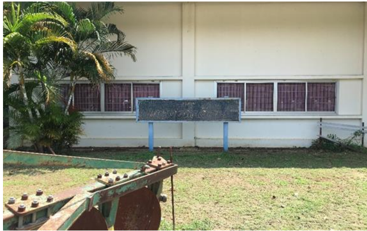
อาคารเกษตรกลวิธาน