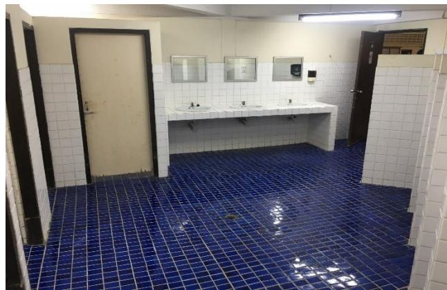
อาคารโรงงานนาร่อง