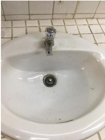
อ่างล้างมือ