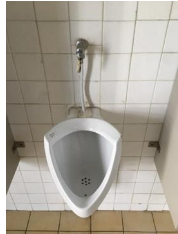
โถปัสสาวะ