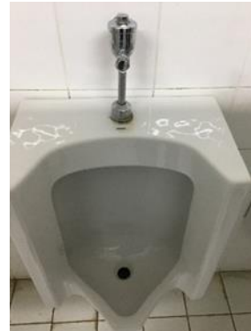
โถปัสสาวะ